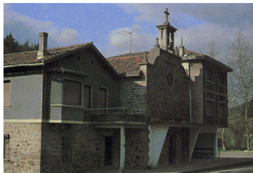
ERMITA DE SAN BERNABE