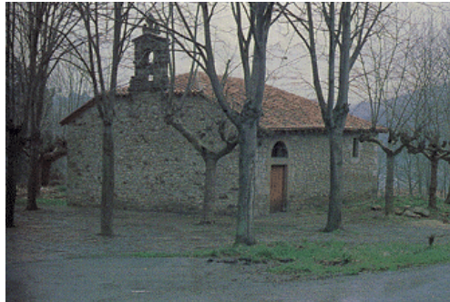
LA ASCENSION DEL SEÑOR

Matrimonios: Ocasionalmente se han celebrado ritos de boda.