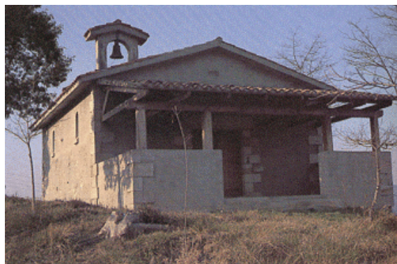
ERMITA DE SAN ANTONIO ABAD

Erección de la nueva ermita: La actual ermita es de construcción reciente. Su inauguración tuvo lugar el 10 de julio mde1977.